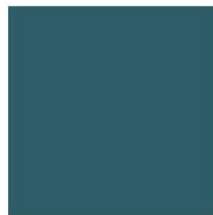
Petrol Blue BT9