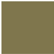
Moss Green YG3